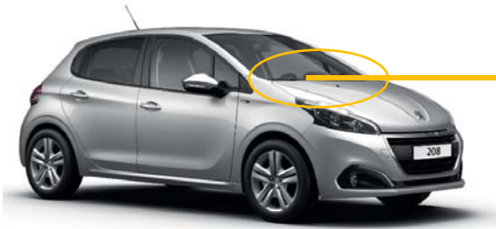
盗難発生警報装置のコネクタ