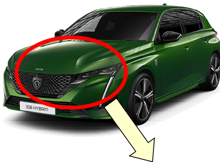
ハイブリッドオートマチックトランスミッション